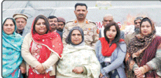
اسٹیشن ایف کے ڈی ایف ایم ایف کے کمانڈر جنرل شہزاد گل کے ہمراہ سربراہان کا گروپ