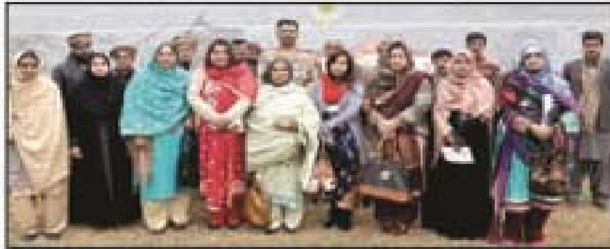
راولپنڈی، مغل پورہ، گورنمنٹ کالج، راولپنڈی، پاکستان کے صدر کونسل کے وفد کے ساتھ